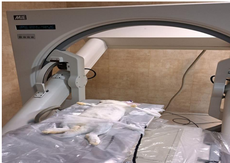
تصویر ۱. دستگاه دوربین گاما اسکن و حالت گماری خرگوش بر روی آن